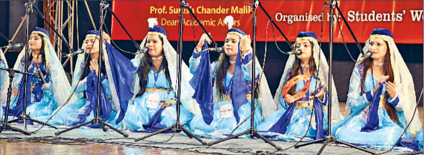
यूथ फेस्टिवल के दौरान कव्वाली प्रस्तुत करती प्रतिभागी।