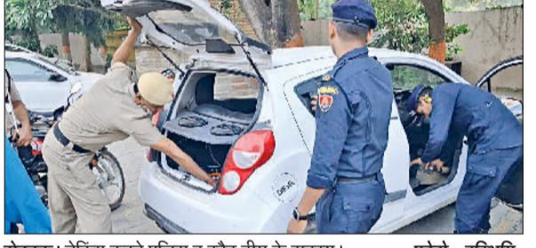
रोहतक। चेकिंग करते पुलिस व सैट टीम के सदस्य।