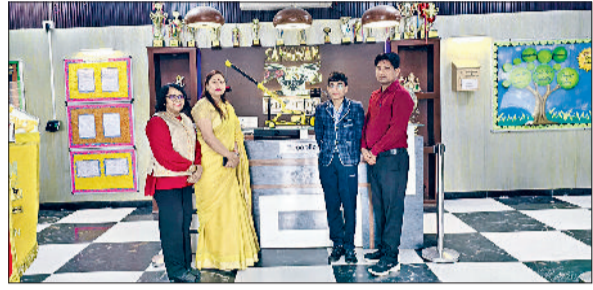
रोहतक। विज्ञान निबंध प्रतियोगिता में मौजूद विद्यार्थी व शिक्षक।