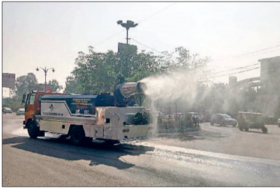
रोहतक। सड़कों पर पानी का छिड़काव करती मशीन।

निर्माण कार्य अगले आठवें तक बंद रहेंगे, निर्माण सामग्री को ग्रीन मैट से ढकना जरूरी होगा। वेस्ट खुले स्थानों पर न डालें नहीं तो निगम की टीम चालान करेगी। सिंगल यूज प्लास्टिक का प्रयोग न करें क्योंकि इससे प्रदूषण में इजाफा होता है। कचरे में आग न लगाएं, निगम वाहन को ही सौंपें ताकि उसे जलाने से रोका जा सके। सही जगह पर ही कूड़े का निस्तारण किया जा सके।